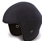
UPA00001 IMBOTTITURA INVERNALE