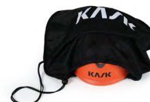
UAC00002 SACCA PORTACASCO