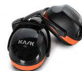
WHP00001 CUFFIE ANTIRUMORE