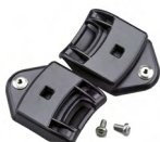
WAC00003 ADATTATORE A BAIONETTA